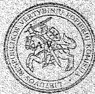
Vertybinių popierių komisijos pirmininkė Vilija Nausėdaitė

Licencija išduota Lietuvos Respublikos vertybinių popierių komisijos 2007 m. rugsėjo 6 d. sprendimu Nr. 2K-286.